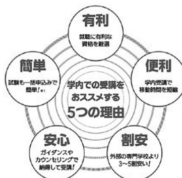
JUキャリアラウンジ5つのメリット