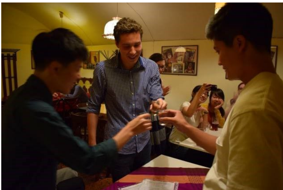
エルテ大学日本語クラブの様子

そんな怠惰な太陽の一日に、この時期は、どんなに勤勉な学生も、寝坊して授業に遅れてしまうなどすこし怠けてしまうそうです。ハンガリーでの勉強については、前回も同じ内容だったと思いますが、日々が学習漬けです。朝8時から、遅いときは6時過ぎの授業まで授業に出席し、帰寮後直ちに復習と予習をします。晩ご飯を食べて、ハンガリー語を勉強です。それはまるで、単調なゲームをやっているような、しかし緩急があって飽きのない、思惑が入る余地がないといったほうがより忙しそうなお表現で的確かもしれません。とにかく、日々が充実していて非常に楽しく過ごしています。