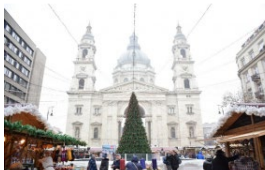
Christmas Market in Szent István Bazilika

まずハンガリーの様子をお伝えします。日本では、関東でも積雪があるなど、冬景色の様子を思い浮かべます。しかし、ハンガリーでは、降雪はあるものの、積もることはまだありません。その理由はハンガリーが内陸に位置し、さらに、北東をカルパチア山脈に囲まれた盆地にあるからです。また、古代にはパノニア海と呼ばれる大きな湖があり、その水が流れ出して大平原ができました。ハンガリーの国土は周囲の土地よりも低い地形になっています。そのため、海からの湿った空気は、ハンガリーに流れ込むころには、すっかり乾燥してしまい、よってハンガリーは雪が降りにくい気候なのです。空気がひどく乾燥しているので、日本にいるときよりも肌のケアを入念に行っており、自分の女子力が非常に高まっていると思います。